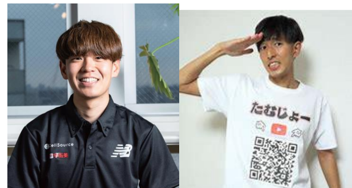
大会参加選手、神野大地選手、 たむじょーとのファンランイベント